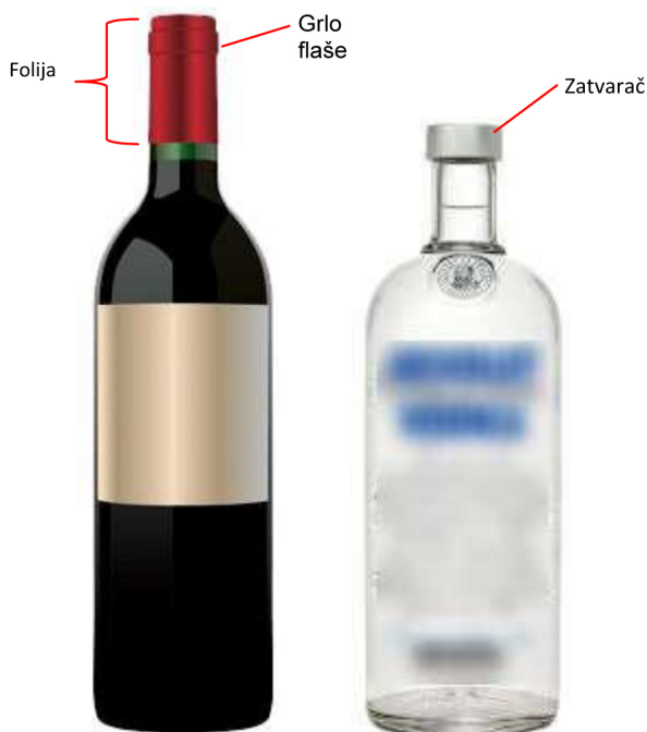
Slika 1. Uobičajena flaša za vino i alkoholno piće

VAŽNO ! Za pravilnu primenu, voditi računa da tag bude zaključan pre stavljanja na flašu.