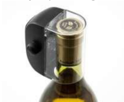
Slika 2. Uobičajena primena taga

VAŽNO ! Za pravilnu primenu, voditi računa da tag bude zaključan pre stavljanja na flašu.